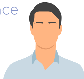
Jérôme - Google

« Merci au responsable et à toute l'équipe pour leur accompagnement en amont et durant notre manifestation. Merci pour votre disponibilité et réactivité. »