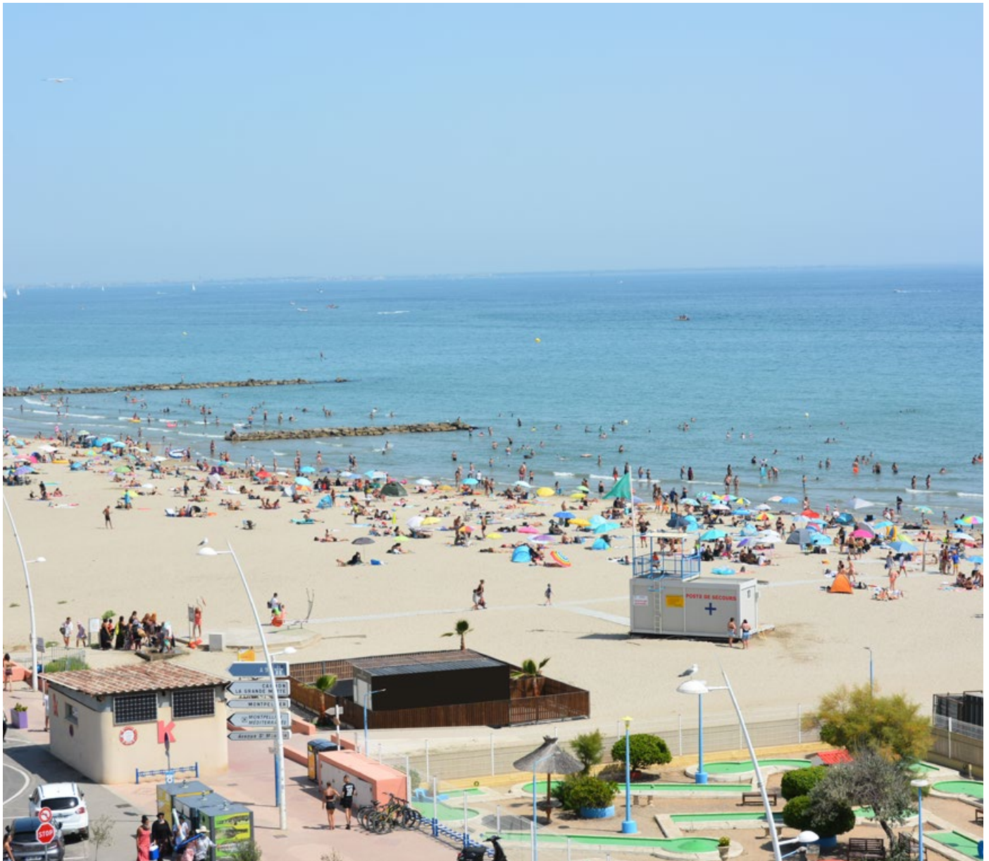
Plage centre

Nous trouverons une solution. Les lagunes sont une nurserie pour les poissons juvéniles. Supprimer les étangs reviendrait à supprimer les poissons. C'est l'une des raisons pour lesquelles nous travaillons à la protection des étangs.