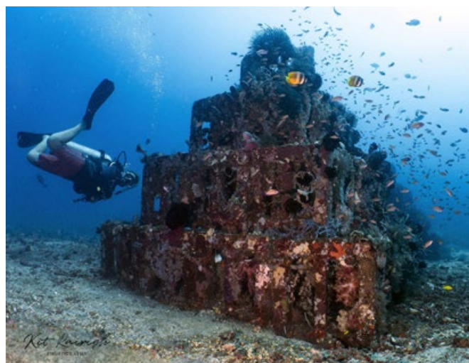
Un récif artificiel semblable à celui qui sera installé à Palavas