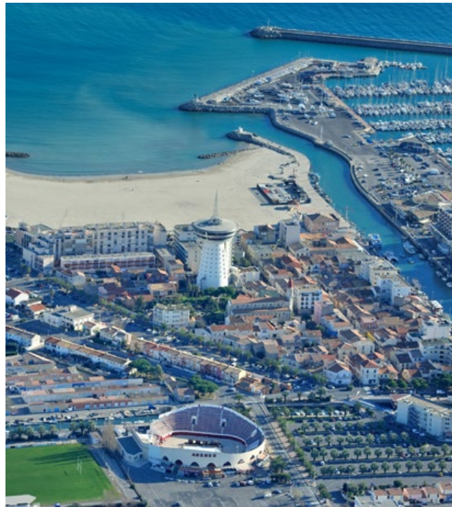
Vue aérienne