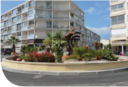
Fleurissement de la ville