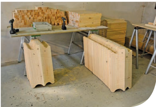
Atelier de menuiserie