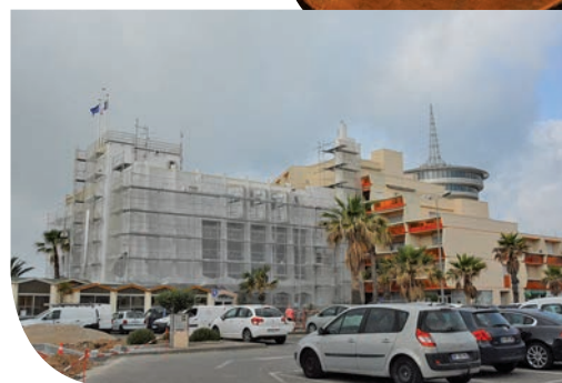
Rénovation de la façade de la Mairie