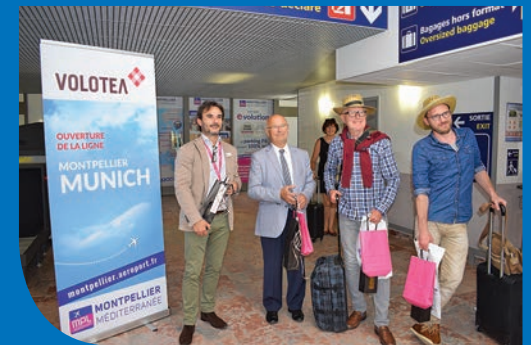
Monsieur le Maire distribuant des cadeaux aux passagers de la nouvelle ligne Munich-Montpellier.