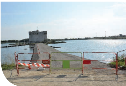
Nouvelle promenade au Parc du Levant