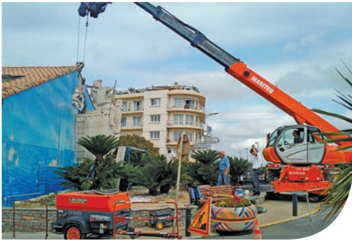
Déplacement de la statue Neptune