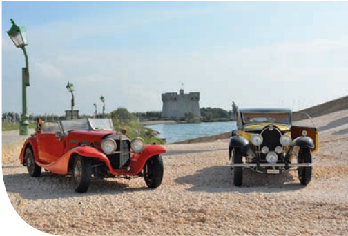
Musée du modèle réduit